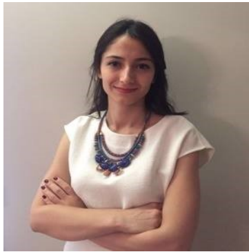
Elif Can Çelebieser Köy